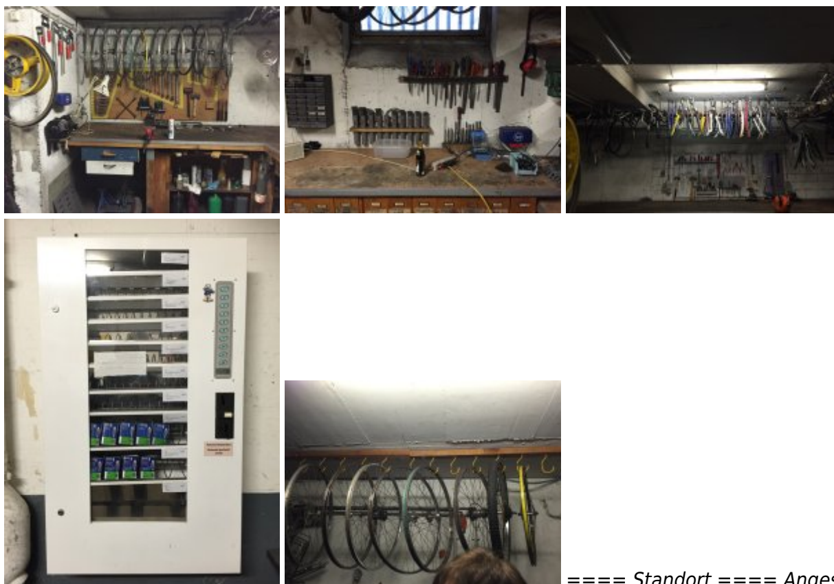
==== Standort ==== Angestrebt wird ein Raum in einem KIT Gebäude am Süd Campus, der mit Fahrrädern gut zugänglich ist und genügend Platz für das Inventar und die gleichzeitige Montage von mindestens 3 Fahrrädern bietet. Es wird stark auf einen Raum hingewirkt, da dieser auch im Winter gut nutzbar wäre. Räume: Beim